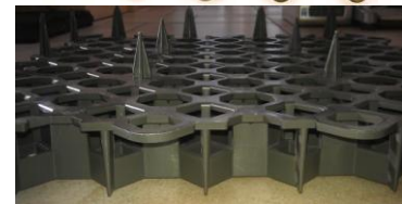
Unterseite mit 12 Spitzen

Das Universalgitter ist leicht und schnell zu montieren, es kann mit Parkplatzkappen geliefert werden und ist bis zu 160t/m 2 belastbar! Resistenz gegen atmosphärische Bedingungen. Widerstandsfähigkeit dank der Honigwaben Form.