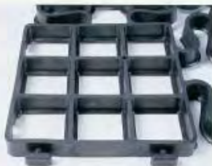
Schwabengitter ® Ontop, Oberseite