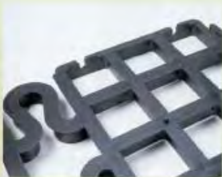
Unterseite: Stegbreite 16 mm - gegen Einsinken

Fläche planieren, stark walzen, 100 g/m 2 NPK-Grunddünger ausbringen. Fläche mit Rasengittersaatgut ansäen, Schwabengitter ® Ontop auflegen und leicht anwalzen. Feucht halten, Rasen wächst in Kürze durch das Gitter.